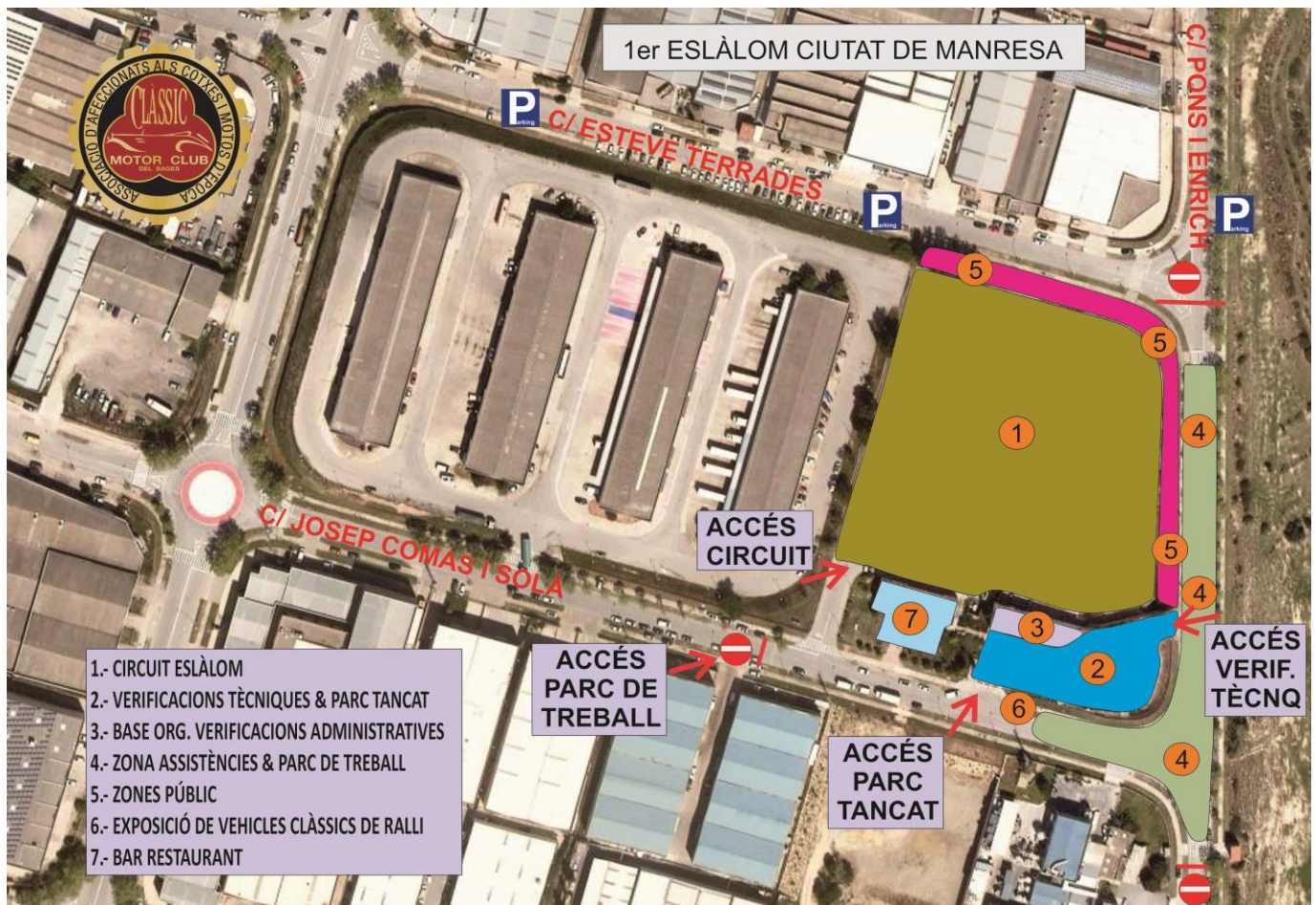
Plànol situació, ubicacions i accessos.