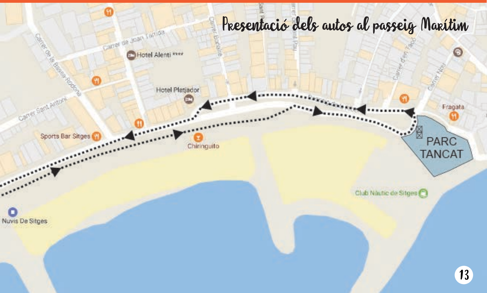
Presentació dels autos al passeig Marítim