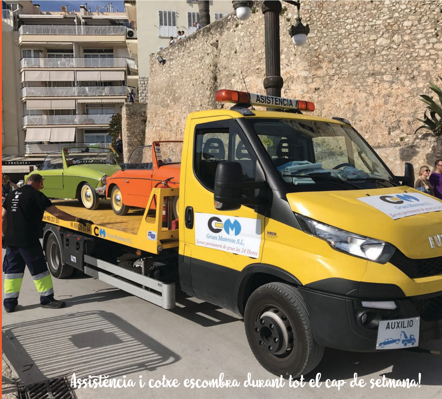
Assistència i cotxe escombra durant tot el cap de setmana!