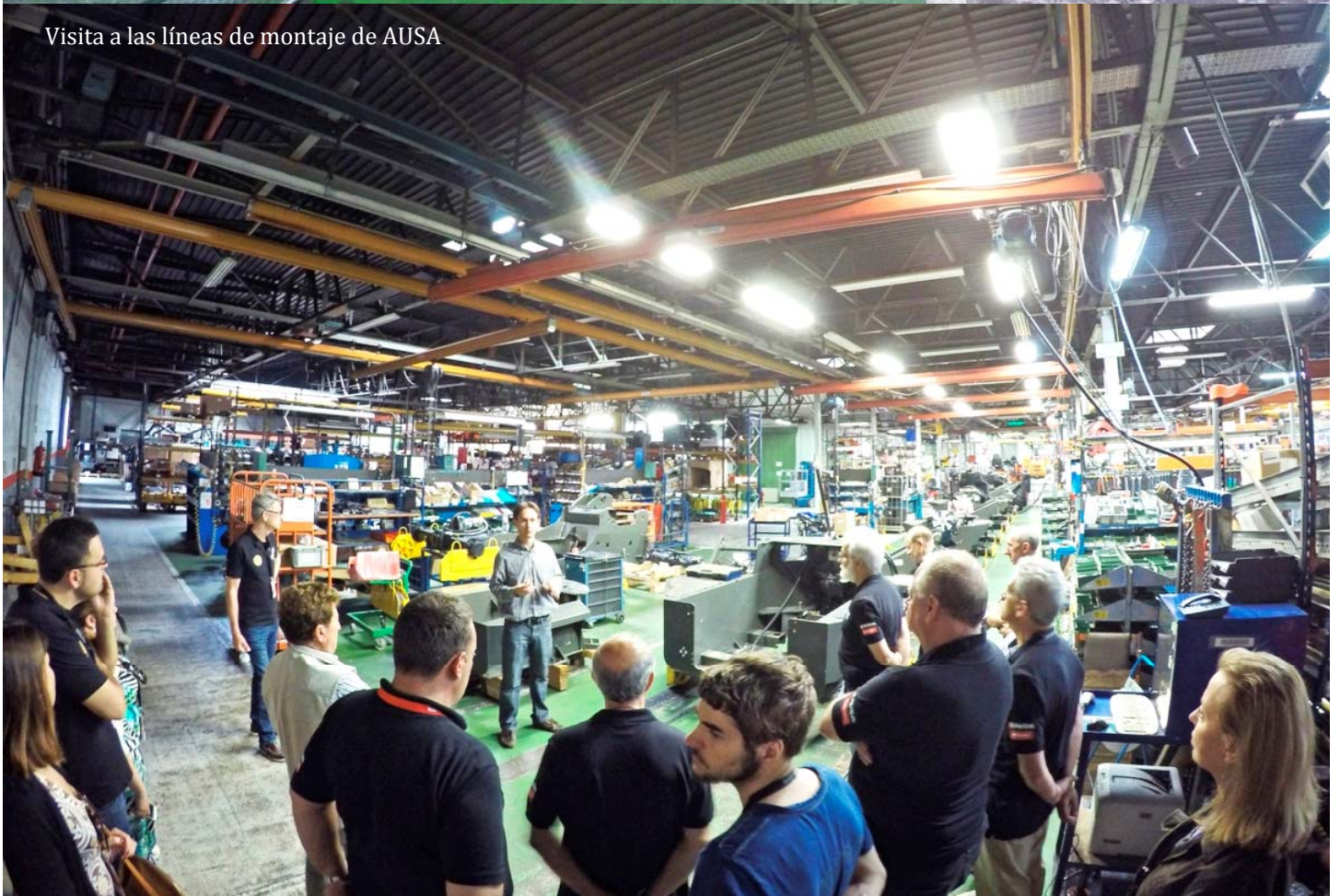
Visita a las líneas de montaje de AUSA