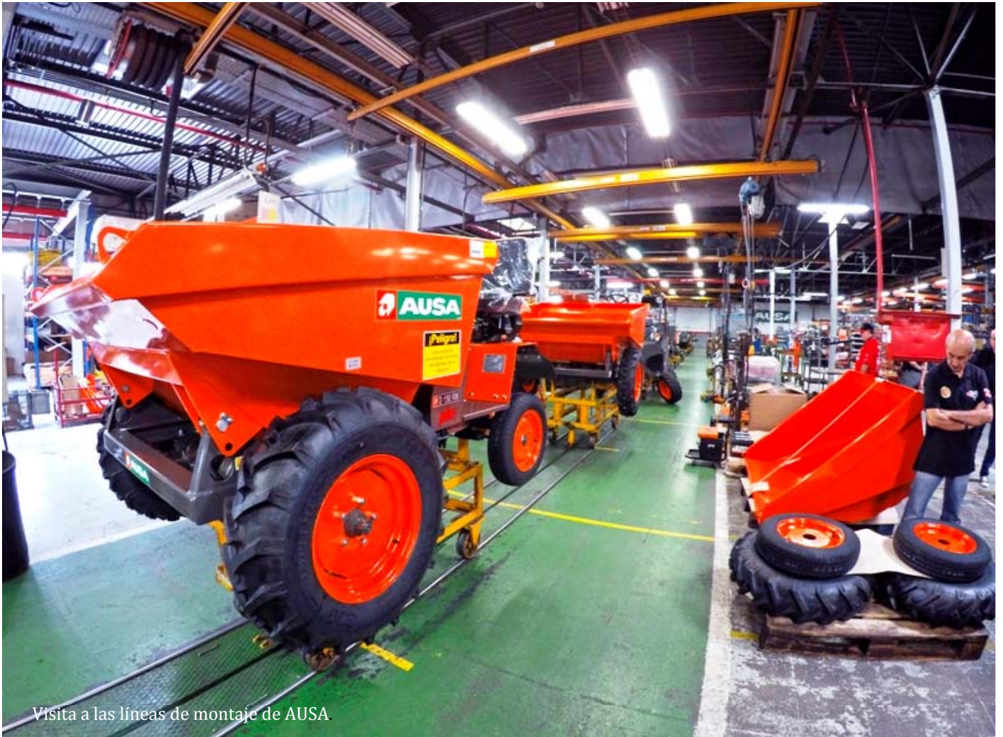
Visita a las líneas de montaje de AUSA