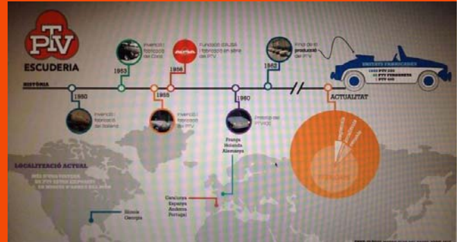
Cuadro de las ventas mundiales de PTV's.