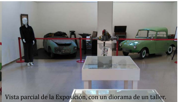
Vista parcial de la Exposición, con un diorama de un taller.