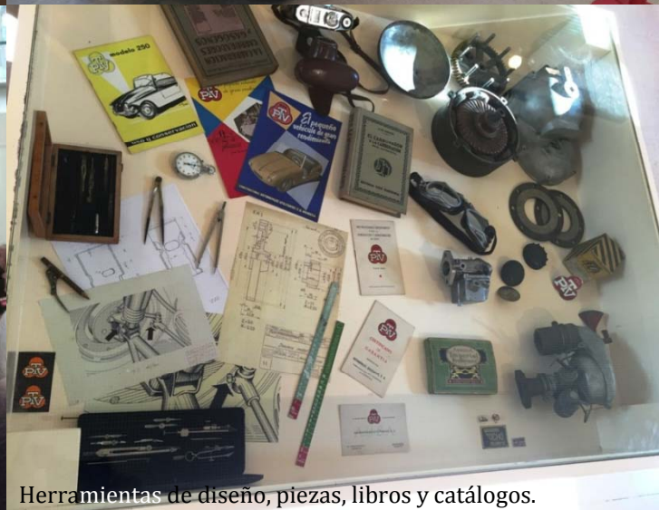
Herramientas de diseño, piezas, libros y catálogos.

La Exposición del 60 Aniversario del PTV tuvo lugar en la Sala Espai 7 del edificio del Casino de Manresa, situado en el Passeig Pere III, y fue inaugurada con la presencia de la Delegada del Departament d'Empresa i Territori de la Generalitat de Catalunya, la 1ª Teniente de Alcalde de l'Ajuntament de Manresa, los directivos del Clàssic Motor Club del Bages, y los propietarios de PTV participantes, junto con exempleados de la fábrica y público en general.