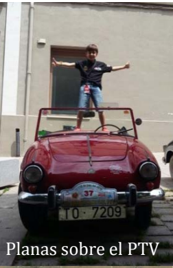
Planas sobre el PTV