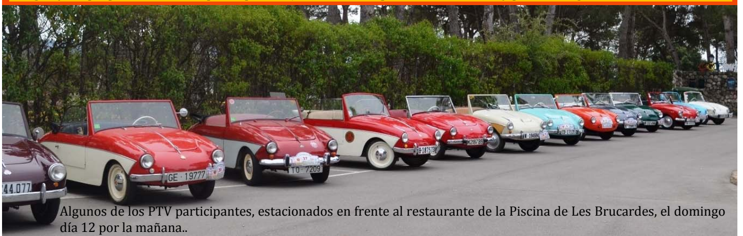
Algunos de los PTV participantes, estacionados en frente al restaurante de la Piscina de Les Brucardes, el domingo día 12 por la mañana..

La Exposición del 60 Aniversario del PTV tuvo lugar en la Sala Espai 7 del edificio del Casino de Manresa, situado en el Passeig Pere III, y fue inaugurada con la presencia de la Delegada del Departament d'Empresa i Territori de la Generalitat de Catalunya, la 1ª Teniente de Alcalde de l'Ajuntament de Manresa, los directivos del Clàssic Motor Club del Bages, y los propietarios de PTV participantes, junto con exempleados de la fábrica y público en general.