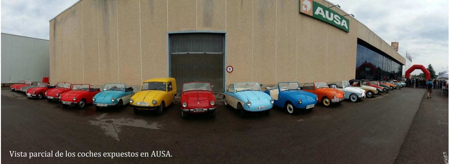
Vista parcial de los coches expuestos en AUSA.