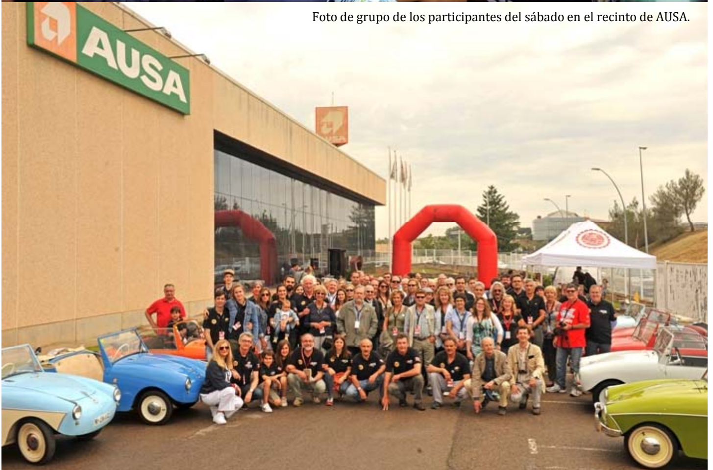
Foto de grupo de los participantes del sábado en el recinto de AUSA.