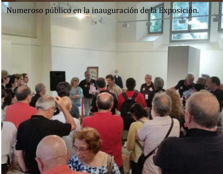
Numeroso público en la inauguración de la Exposición.