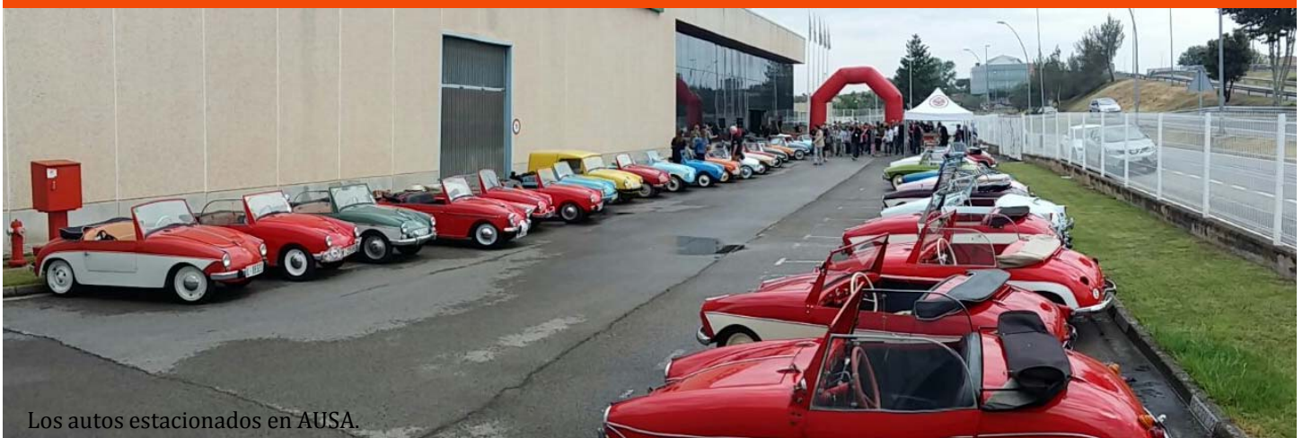
Los autos estacionados en AUSA.