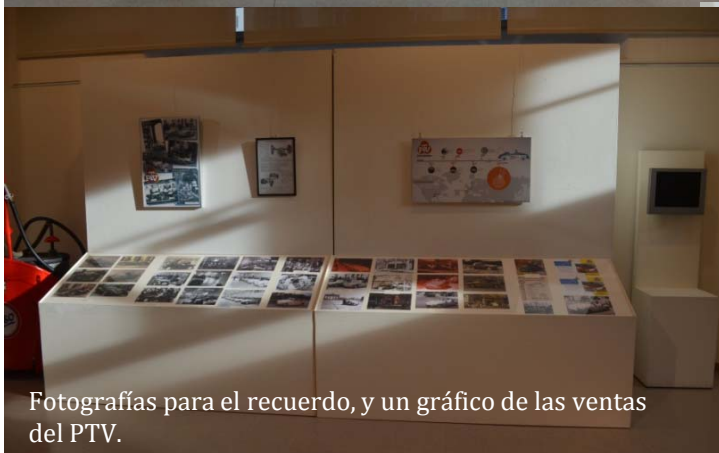
Fotografías para el recuerdo, y un gráfico de las ventas del PTV.