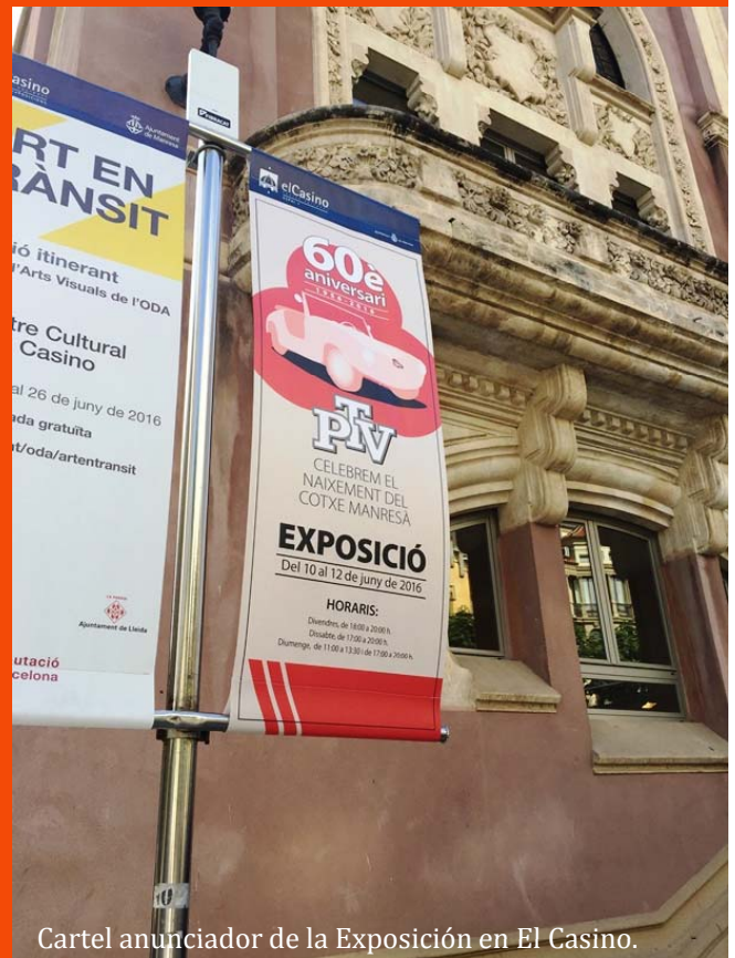
Cartel anunciador de la Exposición en El Casino.