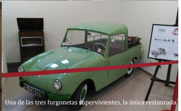
Una de las tres furgonetas supervivientes, la única restaurada.